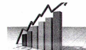
GRÁFICO DE ESTATÍSTICAS DE INFRAÇÕES DE TRÂNSITO - AIT

GUARDA CIVIL MUNICIPAL DE PORTO FERREIRA Av. Nicolau de Vergueiro Forjaz, 1066 - Centro - CEP. 13660-000 - Porto Ferreira / SP Telefones:- (19) 3589-5353, 153, 0800-773-1553 - e-mail: gm@portoferreira.sp.gov.br