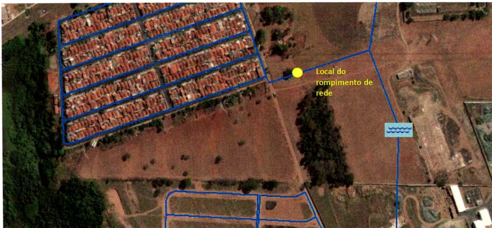
Imagem 1 - Cadastro das redes de água no Jardim Águas Claras, as quais houve a necessidade de manutenção.

Rua Nelson Pereira Lopes, nº 199 Centro – Porto Ferreira – SP Brasil | CEP 13660-000