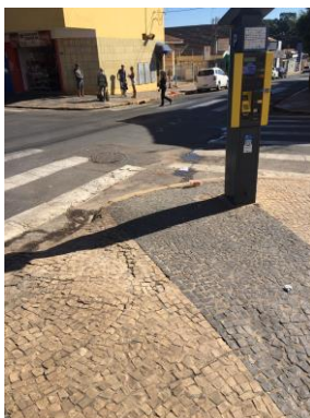
ID nº 1 - Rua Cel. Procópio de Carvalho x Rua Cel. João Procópio

Parquímetro sem desnível e com rampa de acesso há cerca de 1 metro.