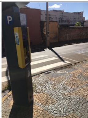
ID n° 9 – Rua 29 de Julho x Rua Dna. Balbina

Parquímetro sem desnível e com rampa de acesso há cerca de 1 metro.