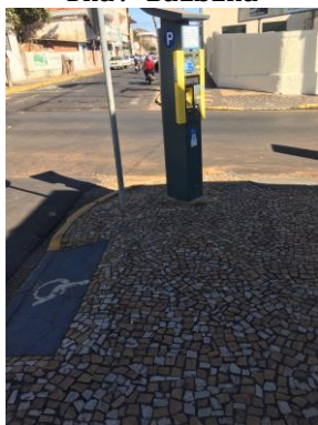
ID n° 8 – Rua Francisco Prado x Rua João Miranda Salgueiro

Parquímetro sem desnível e com rampa de acesso há cerca de 1 metro.