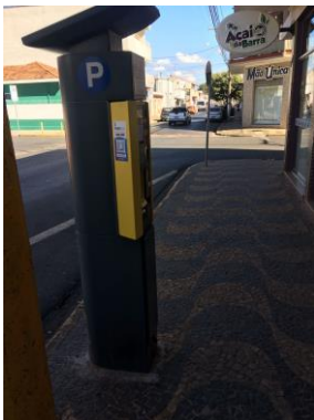
ID n° 17 - Rua Padre Capelli x Rua Nelson Pereira Lopes

Parquímetro sem desnível e com rampa de acesso há cerca de 1 metro.