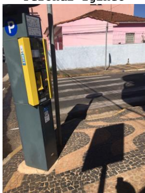
ID n° 12 – Rua Perondi Igíneo x Rua João Miranda Salgueiro

Parquímetro sem desnível e com rampa de acesso há cerca de 1 metro.