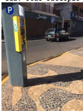
ID n° 7 – Rua Francisco Prado x Rua Dna. Balbina

Parquímetro sem desnível e com rampa de acesso há cerca de 1 metro.