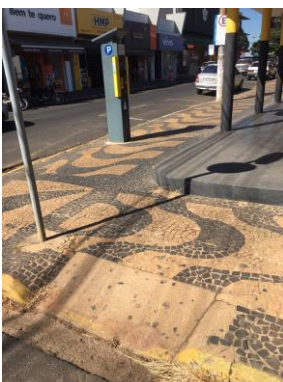
ID n° 14 - Rua João Mutinelli x Rua Dna. Balbina

Parquímetro sem desnível e com rampa de acesso há cerca de 1 metro.