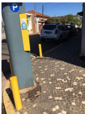
ID n° 10 – Rua 29 de Julho x João Miranda Salgueiro

Parquímetro sem desnível e com rampa de acesso há cerca de 1 metro.