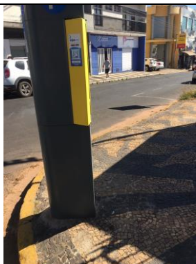
ID n° 13 - Rua João Mutinelli x Rua João Miranda Salgueiro

Parquímetro sem desnível e com rampa de acesso há cerca de 1 metro.