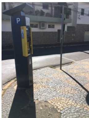
ID n° 11 – Rua Dna. Balbina x Rua Perondi Igíneo

Parquímetro sem desnível e com rampa de acesso há cerca de 1 metro.