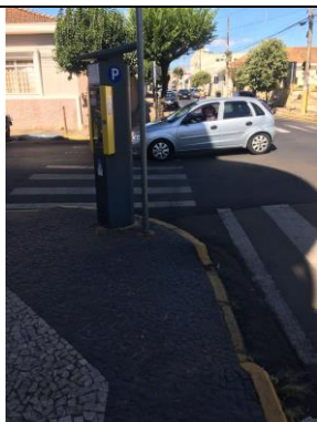
ID n° 5 – Rua Dr. Carlindo Valeriani x Rua João Miranda Salgueiro

Parquímetro sem desnível e com rampa de acesso há cerca de 1 metro.