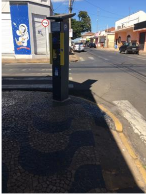
ID n° 16 - Rua Nelson Pereira Lopes x Rua Luís Gama

Parquímetro sem desnível e com rampa de acesso há cerca de 1 metro.