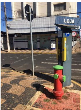
ID n° 15 - Rua Nelson Pereira Lopes x Rua João Miranda Salgueiro

Parquímetro sem desnível e com rampa de acesso há cerca de 1 metro.