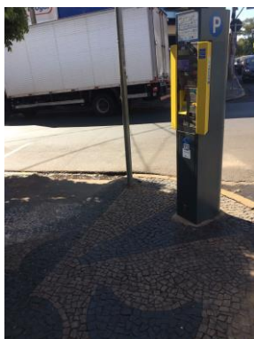
ID n° 6 – Rua Francisco Prado x Rua Cel. João Procópio

Parquímetro sem desnível e com rampa de acesso há cerca de 1 metro.